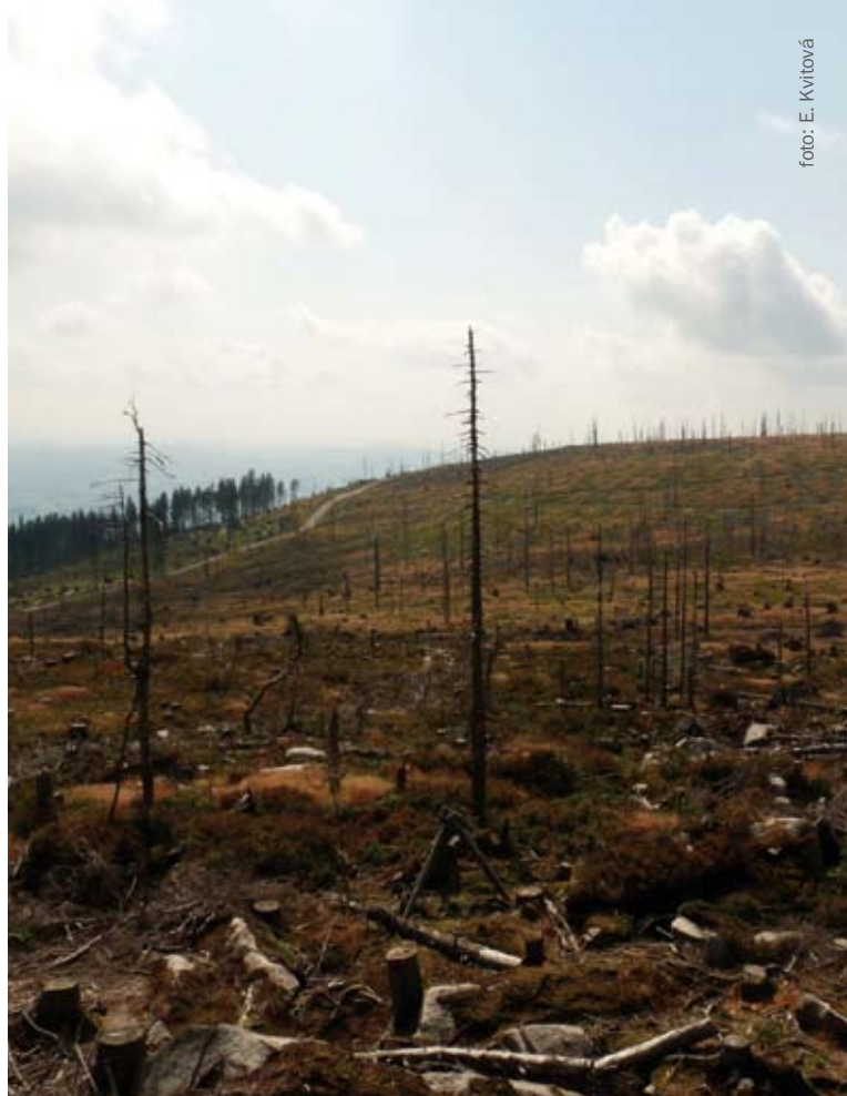
Rozsáhlá holoseč na rakouské straně. Obnažené balvany skalního podloží ukazují, jak dochází ke splachování tenké vrstvy lesní půdy.

Obdobná situace nastala i ve druhé zóně Národního parku Šumava pod Trojmezenským pralesem v okolí takzvané kalamitní svážnice. Širokou cestu nechaly postavit v letech 1988–1989, ještě před vznikem národního parku, vojenské lesy a sloužila ke zpřístupnění oblasti kvůli těžbě dřeva. Náhlé oslunění ovšem oslabilo stromy kolem cesty, což samozřejmě způsobilo, že se do nich pustil kůro-