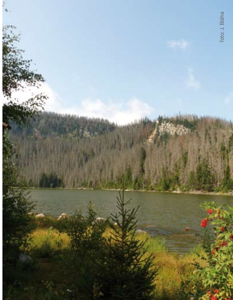
Plešné jezero je perlou šumavské přírody.

Začít na Šumavě s kácením kůrovcem napadených stromů ve velkém napadlo některé lesníky a politiky paradoxně až po vyhlášení národního parku. V roce 1999 ministr Miloš Kužvart, odborníkům navzdory, umožnil kácení i v nejvzácnějších pralesích – tedy i na Trojmezí. Skupina vědců na to odpověděla: „Zatímco po žíru kůrovce zůstává prales pralesem, motorové pily jej zničí navždy. Je to, jako kdybychom