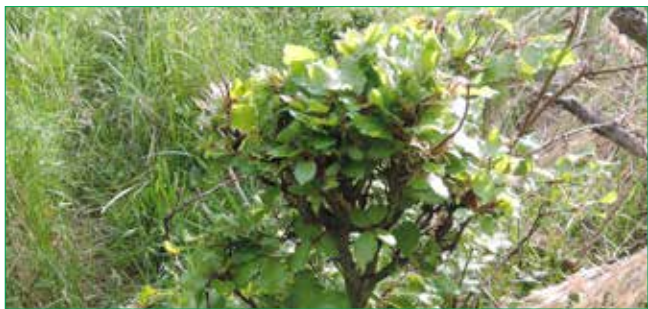
Opakovaným každoročním okusem mladých buků vznikají „bonsaje“, listnáče nemohou růst, naději mají pouze smrky.