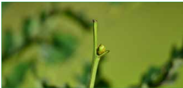
Po okousání vrcholu nejmladší stromky většinou odumírají.