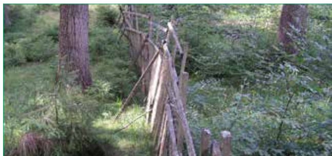
Mimo oplocenku spárkatá zvěř spase přirozené zmlazení, zejména listnáčů a jedle, odrůstají jenom některé smrčky.