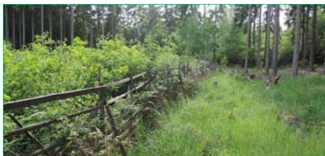
Rozdíl mezi vitální výsadbou kombinovanou s přirozeným zmlazením v oplocence a v jejím okolí, kde přirozené zmlazení spase zvěř.