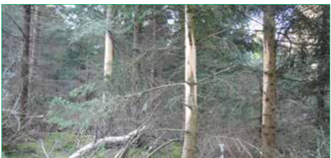
Při loupání a ohryzu se do mladých stromů dostává houba, a ty po několika desetiletích odumírají na hnilobu nebo je oslabené napadají škůdci a dřevo je hnilobou znehodnoceno.