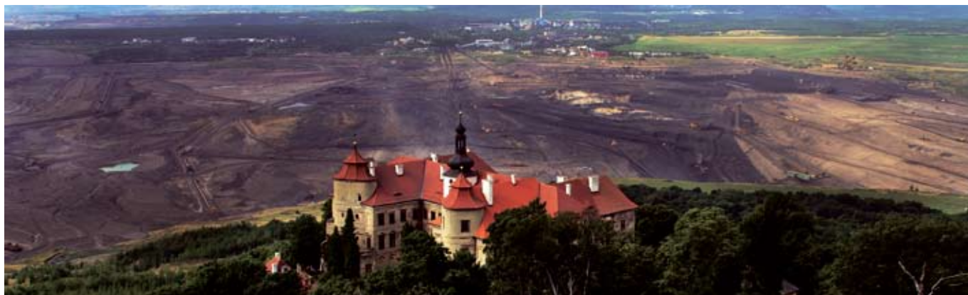
Příležitosti v energetice vytáhnout trn z paty Hornímu Jiřímu.